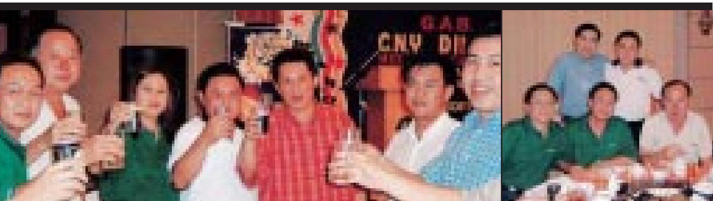
Meraikan kejayaan dan perayaan