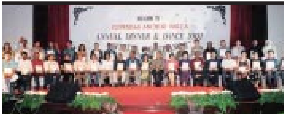
Menghargai pekerja-pekerja lama

Anchor, bir tempatan yang berkualiti dan digemari, juga menjalani proses pelancaran semula untuk memberikan gaya baru yang kontemporari. Dengan pertukaran nama kepada Anchor Smooth, bir yang mempunyai peminat setianya sendiri ini bersedia memainkan peranan lebih penting untuk menyokong usaha meningkatkan bahagian pasaran kami.