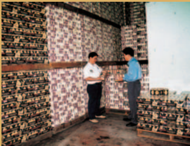
• Pengeluaran lebih tinggi untuk memenuhi permintaan