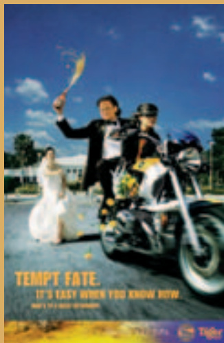
• Keterlihatan lebih tinggi menerusi kempen pengiklanan