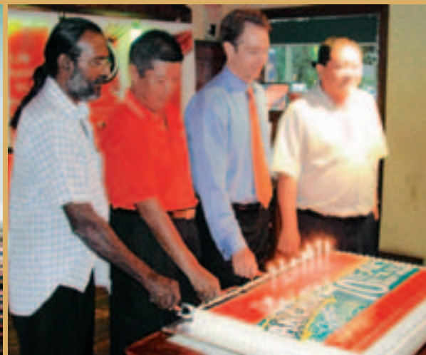
• Tanda penghargaan untuk penyokong setia Anchor

telah meletakkan Syarikat anda di kedudukan yang kukuh bukan sahaja untuk mengambil kesempatan daripada keadaan pasaran yang sesuai, tetapi juga mengatasi cabaran getir dari luar yang kita hadapi dari masa ke masa. Berkenaan hal ini, saya prihatin tentang kesan peningkatan besar duti eksais dalam industri ini terhadap syarikat anda. Namun begitu, saya yakin bahawa dengan keteguhan pihak pengurusan, dan juga pelanggan setia jenama-jenama kami, kejayaan akan tetap dikecapi.